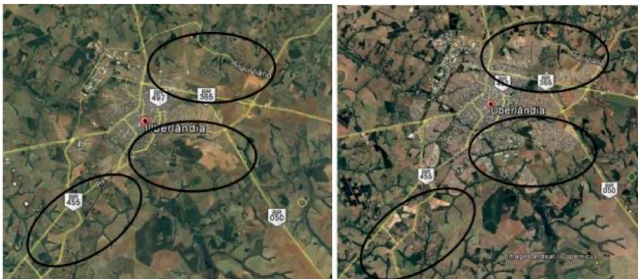
Figura 1 – Evolução da mancha urbana de Uberlândia entre 1994-2016