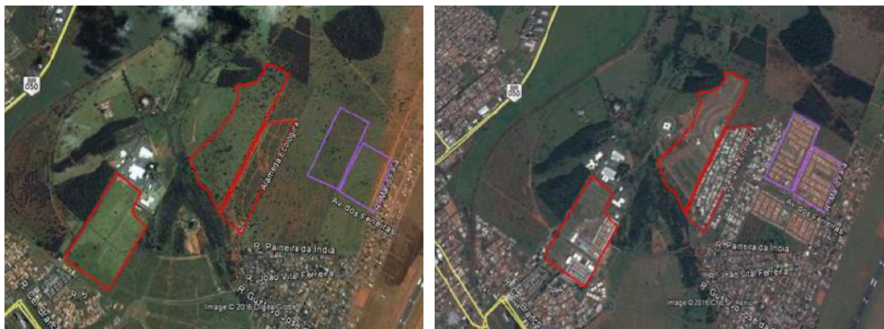
Figura 2 – Ocupação do solo no setor Leste de Uberlândia – MG (2008-2014)

Fonte: Google Earth, adaptado pela autora, 2019