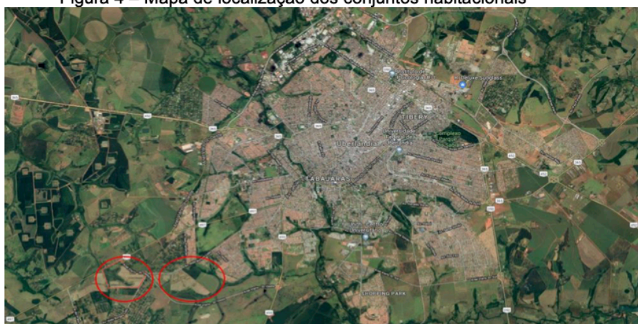
Figura 4 – Mapa de localização dos conjuntos habitacionais