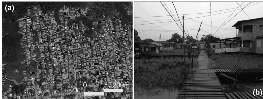
Figura 5 – Palafitas em áreas de ressaca em Macapá: (a) morfologia de assentamento rururbano; (b) configuração interna de uma ocupação consolidada em uma ressaca