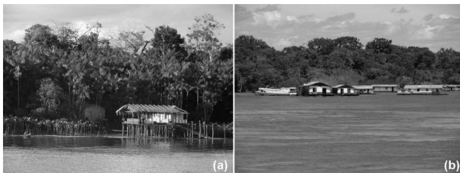
Figura 1 – Habitações ribeirinhas no bioma Amazônia: (a) palafita em trecho rural do rio Amazonas no estado do Pará, note a presença do trapiche (rampa, atracadouro) às pequenas embarcações; (b) moradias flutuantes na configuração de assentamento em área rural do rio Solimões, no estado do Amazonas