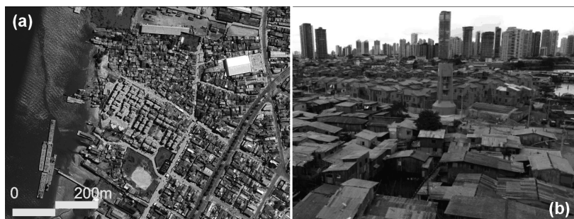
Figura 4 – Palafitas em orla fluvial de Belém: (a) morfologia de assentamento rururbano; (b) Comunidade da Vila da Barca e Projeto Vila da Barca